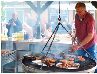
Gegrillt wird ab 18.00 Uhr

Freuen Sie sich auf den Sommer mit Livemusik und Grillabende! Der Grillabend findet in der Saison an jedem Samstag statt. Eine Anmeldung ist nicht erforderlich.