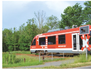
Anreise mit der Bahn