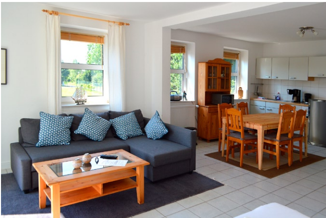
Ferienwohnungen im Kapitänshaus