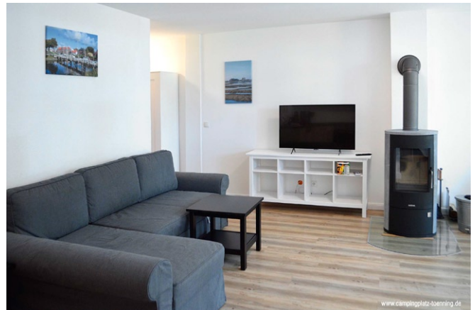
Ferienwohnungen im Freizeithaus